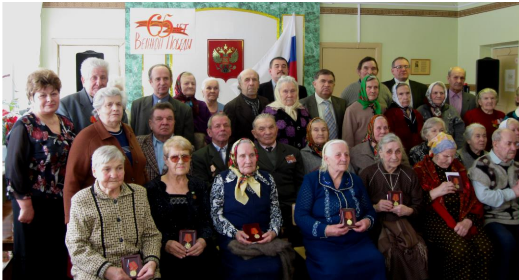
Павловские Ветераны войны и труда после вручения медалей «65-лет Великой Победы»