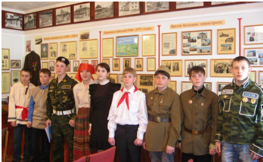
Активисты школьного музея

Павловская средняя школа, 2 февраля 2010 года.