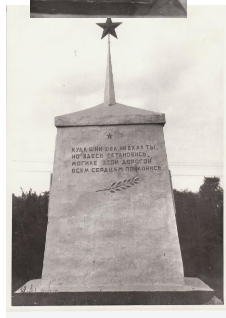
Обелиск павшим воинам. 1965 г.